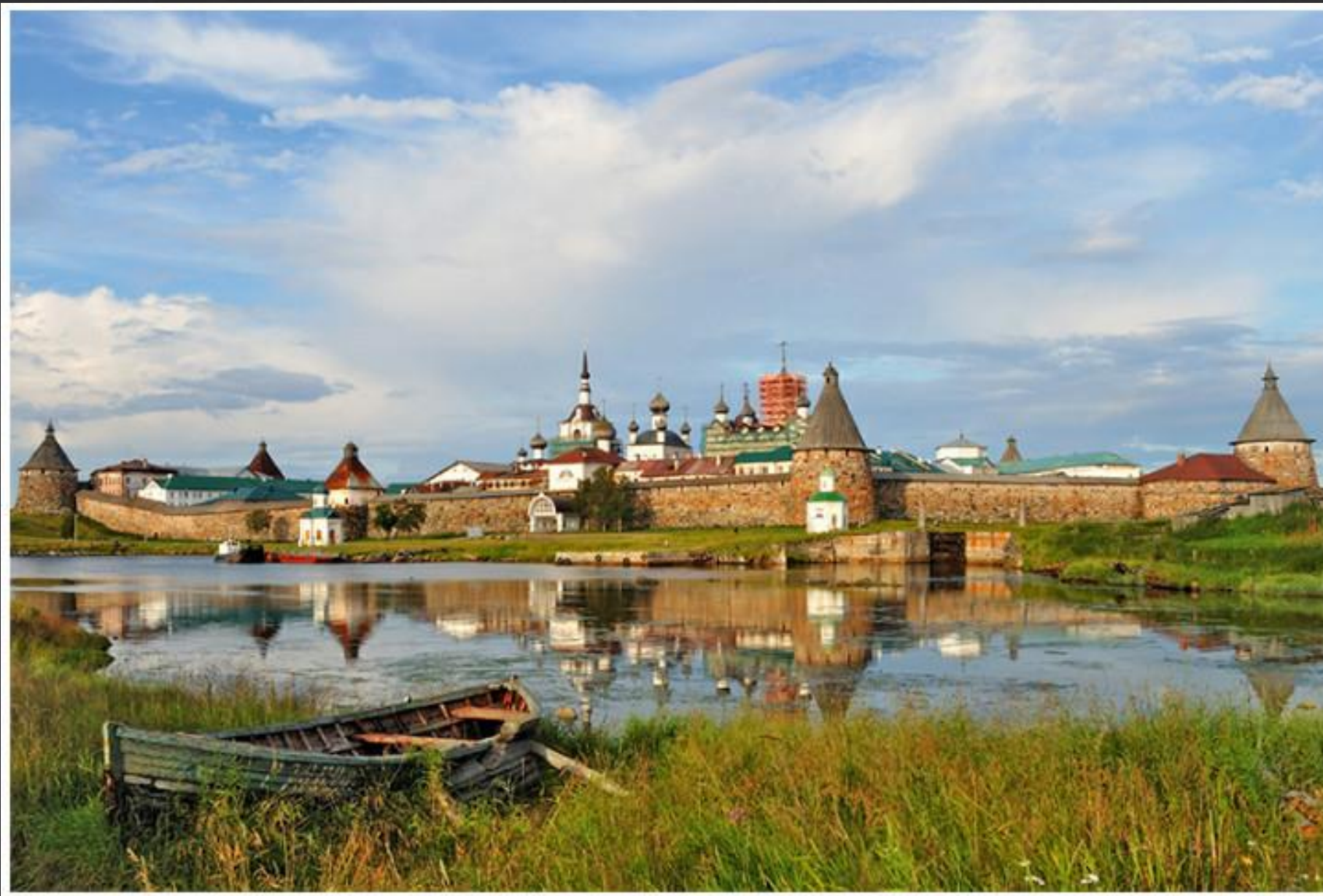
Il Cremlino delle Solovki