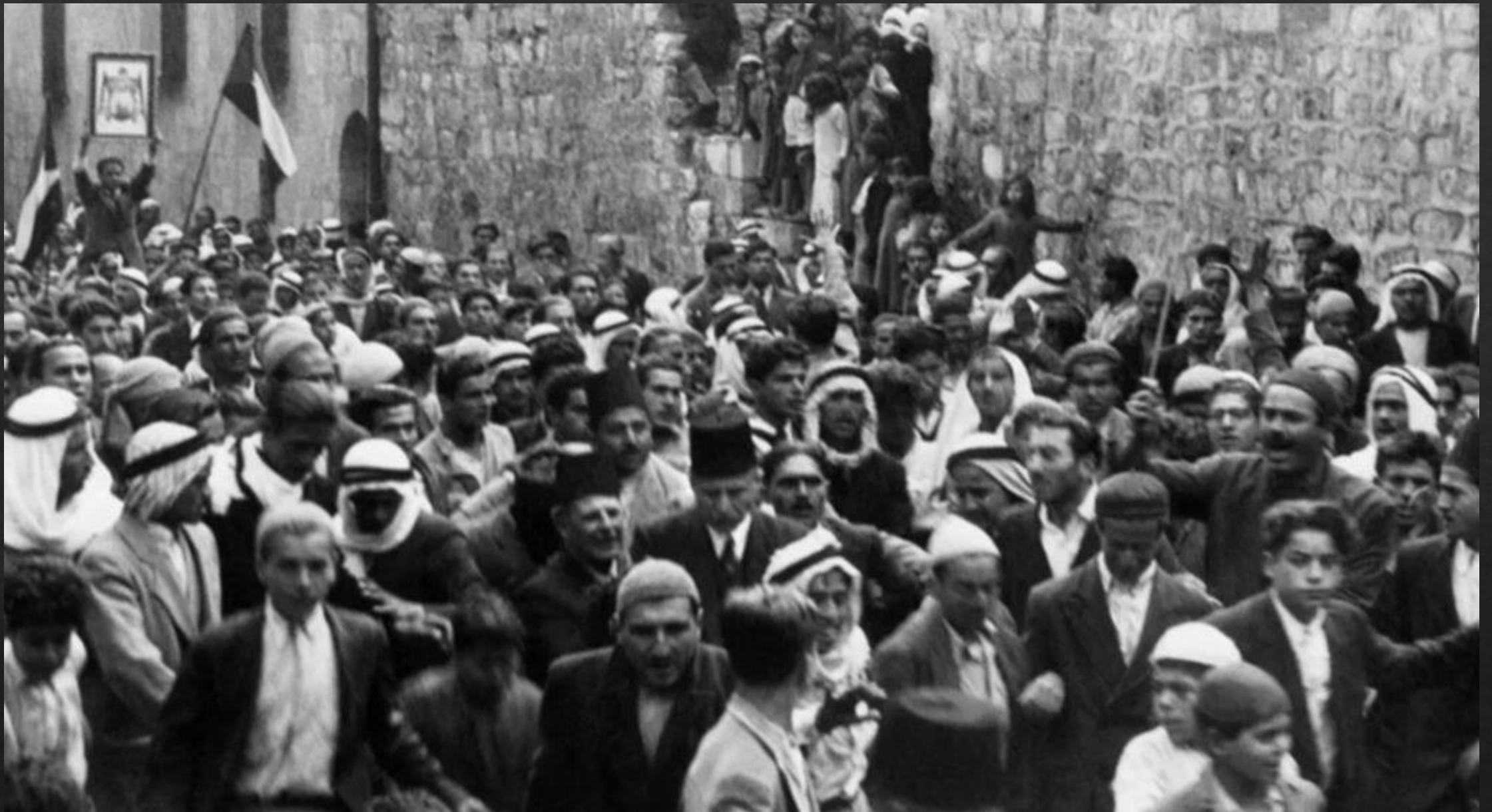
Rivolta araba durante il mandato britannico in Palestina