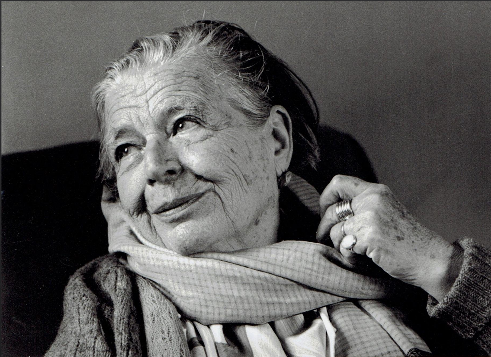
Marguerite Yourcenar Bailleul (1903-1987)