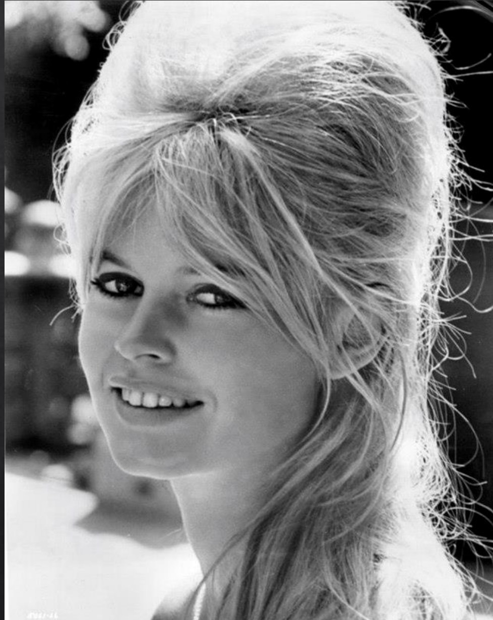
Brigitte Bardot (1934-vivente)