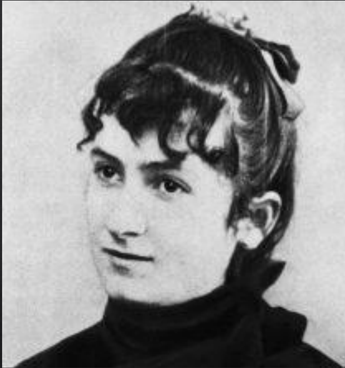
Maria Montessori 1870-1952