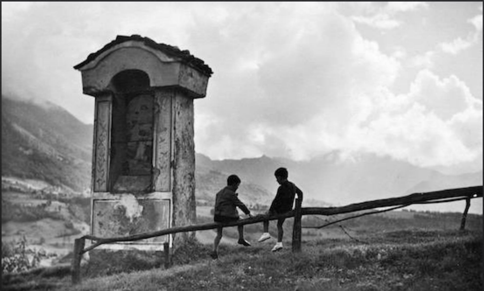
Il bimbo nel viale