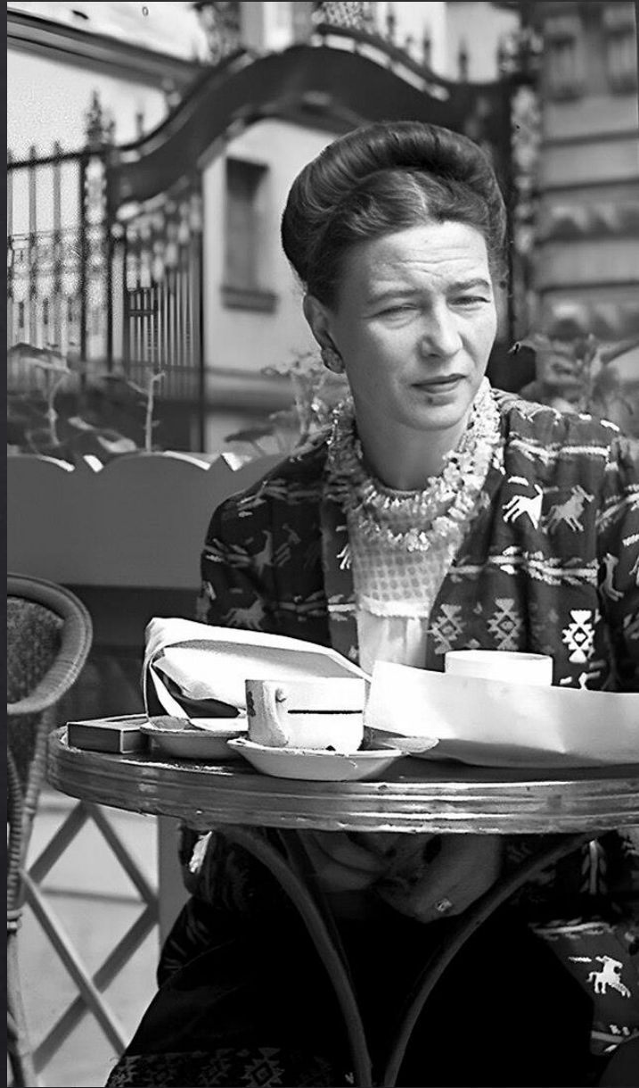
Simone de Beauvoir (1908-1986)