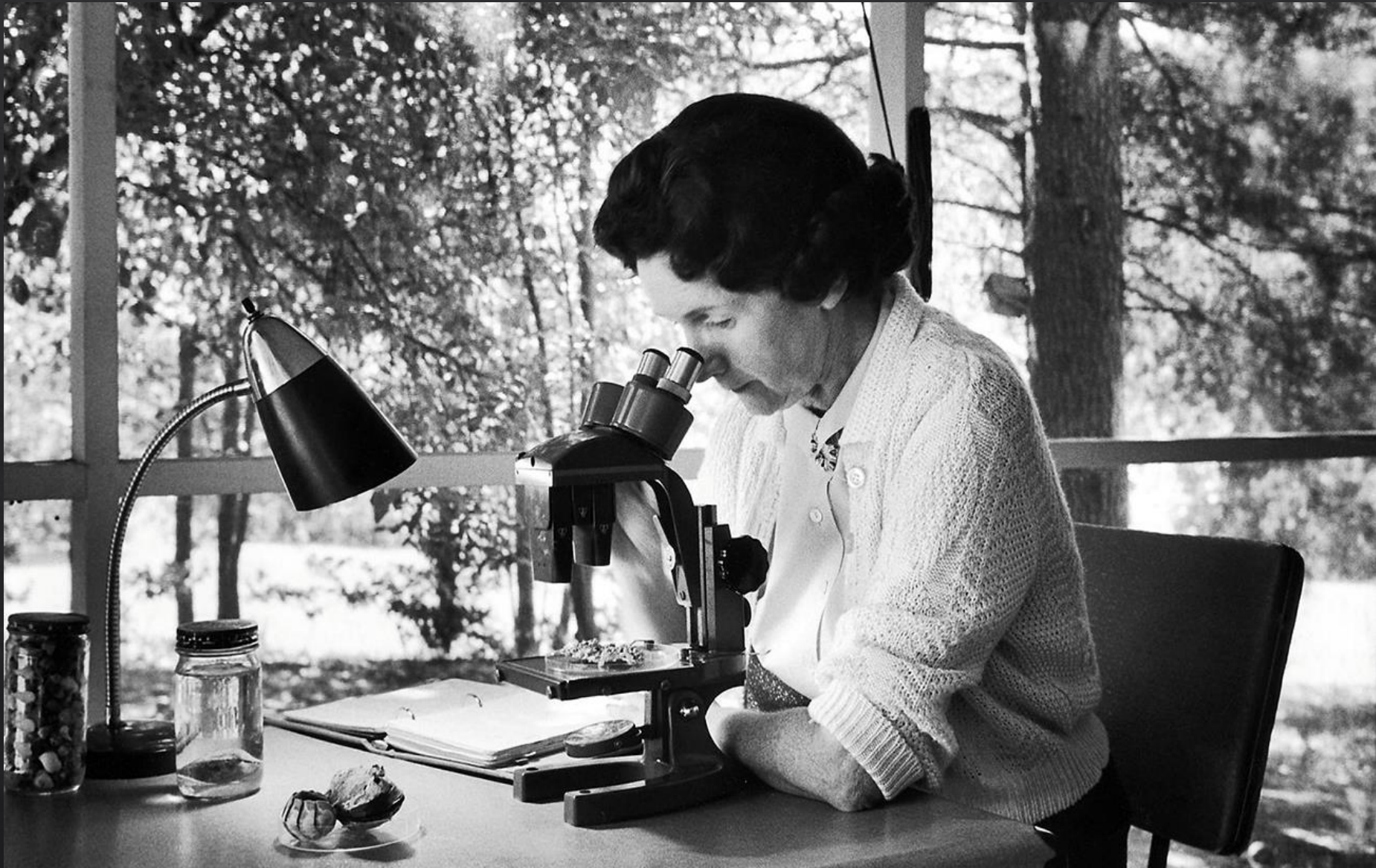
Rachel Carson (1907 – 1964)