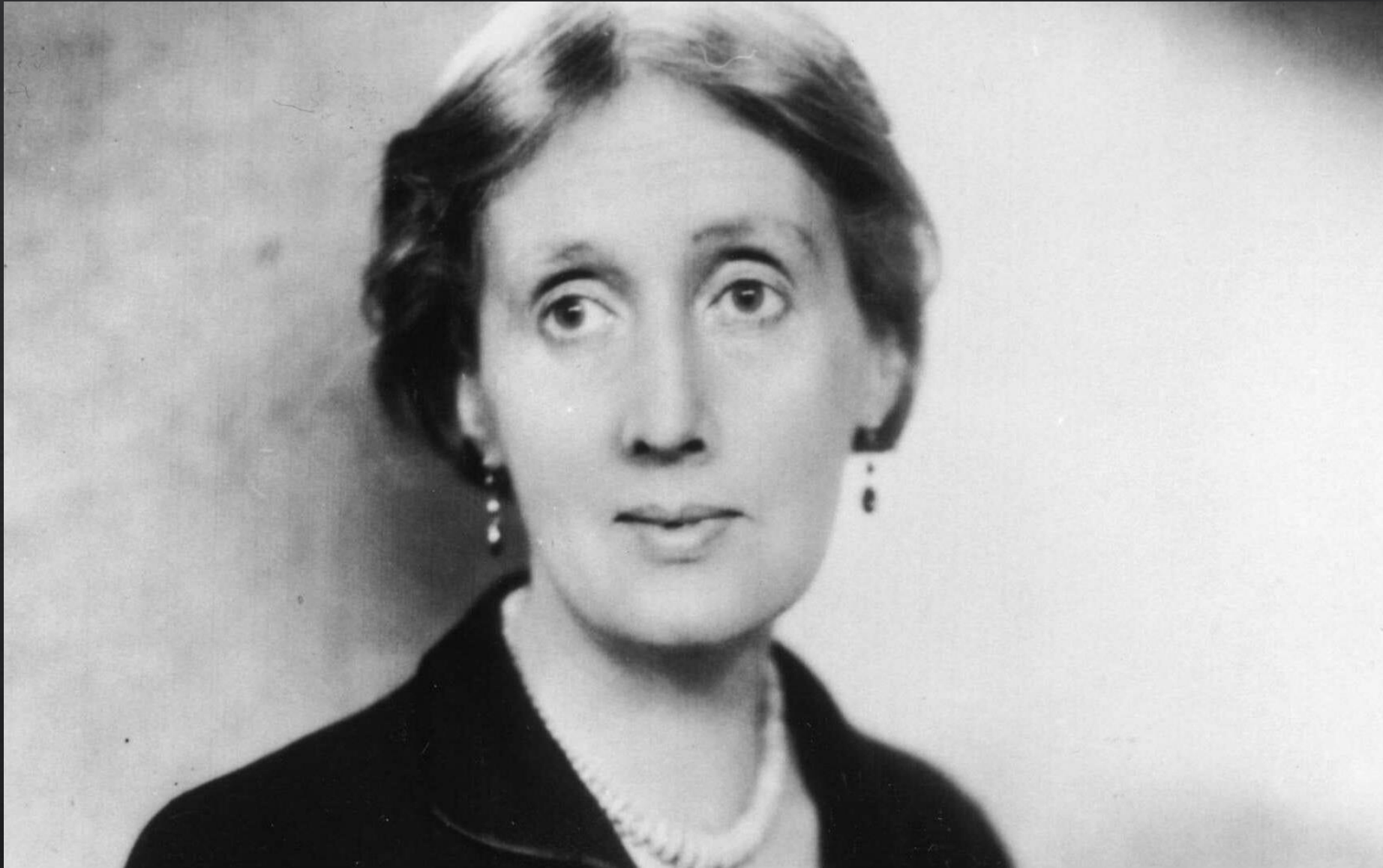
Virginia Woolf (1882-1941)