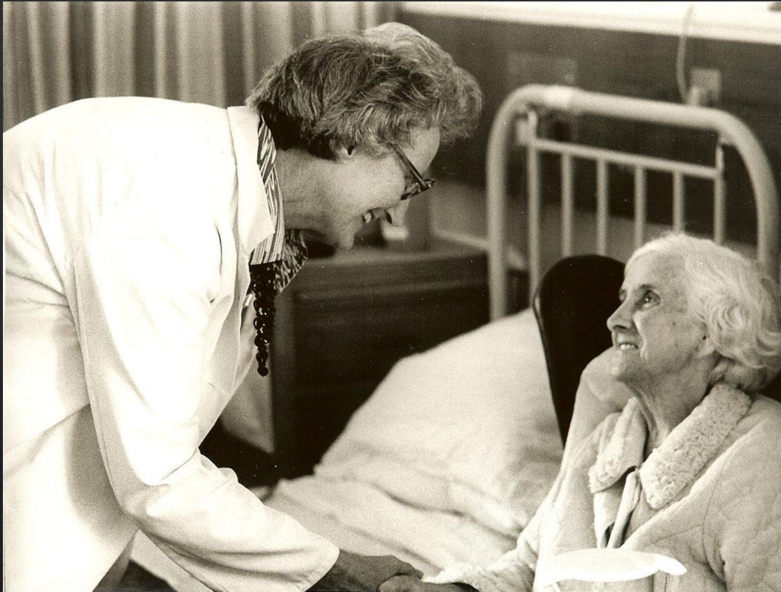
Cicely Saunders (1918 – 2005)