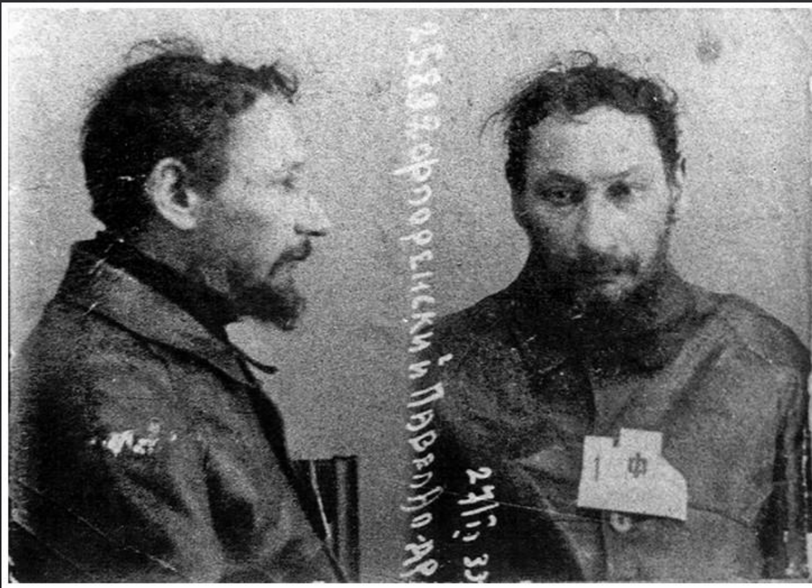
La prima foto scattata dopo l'arresto il 27 febbraio 1933.