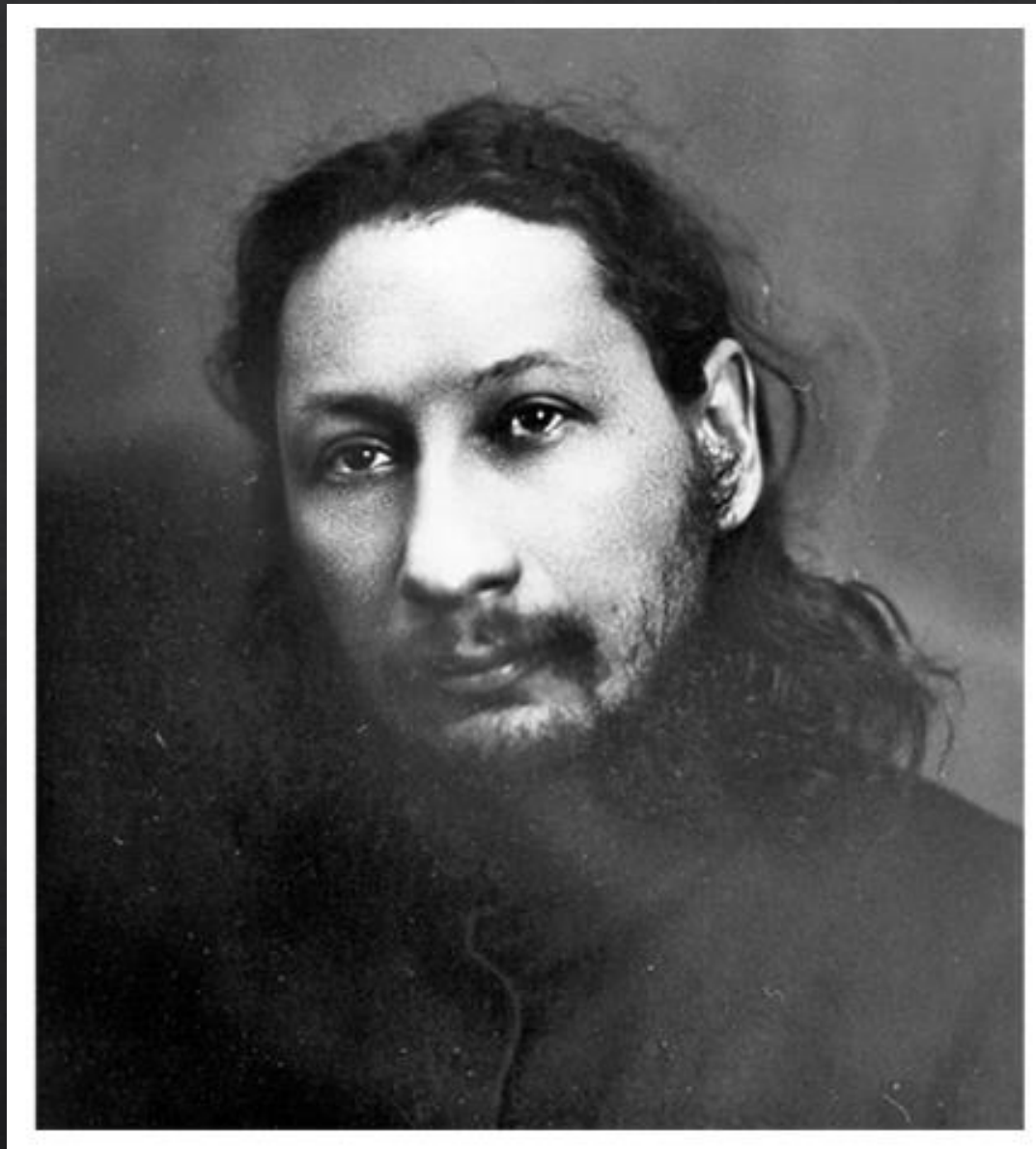
Pavel Florenskij alla fine degli anni Dieci del Novecento