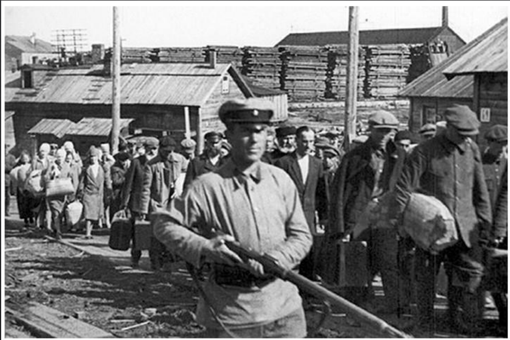
L'arrivo dei nuovi prigionieri alle Solovki.