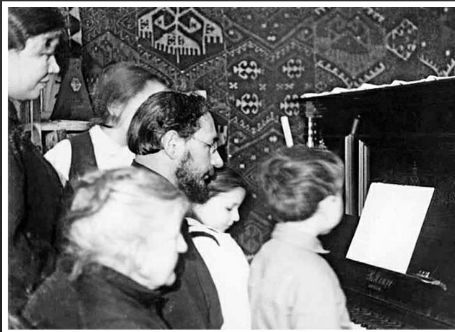
Pavel Florenskij al pianoforte con la famiglia nella sua casa a Zagorsk