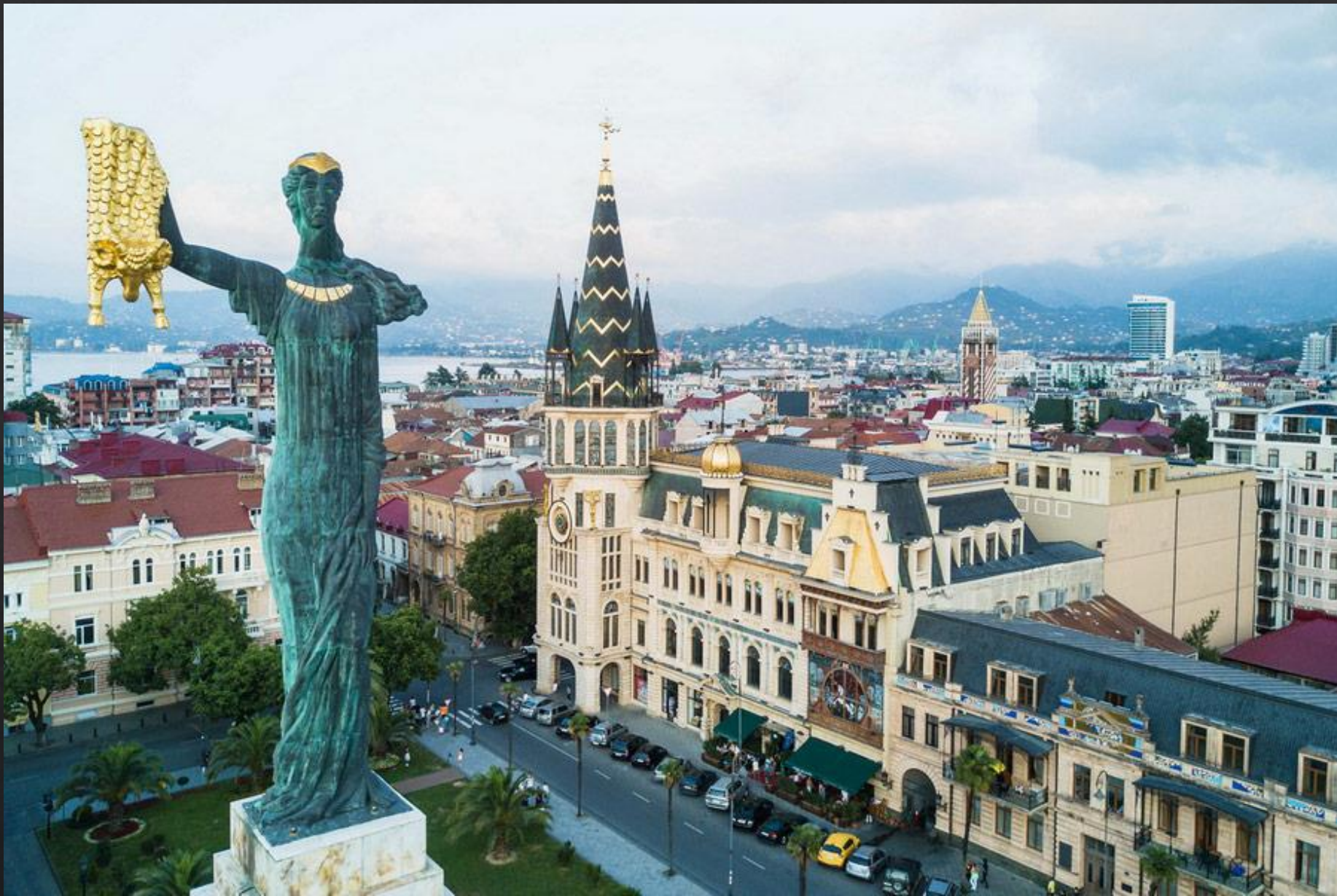
La città di Batumi a fine Ottocento