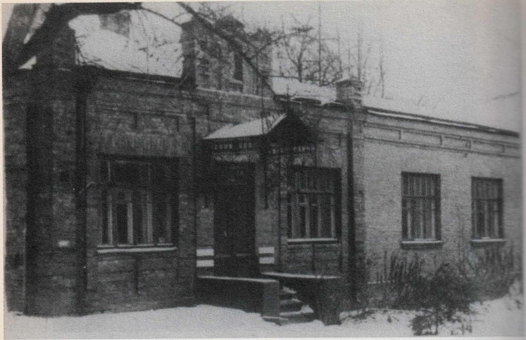
La piccola casa di Berdičev dove la madre visse negli anni Trenta