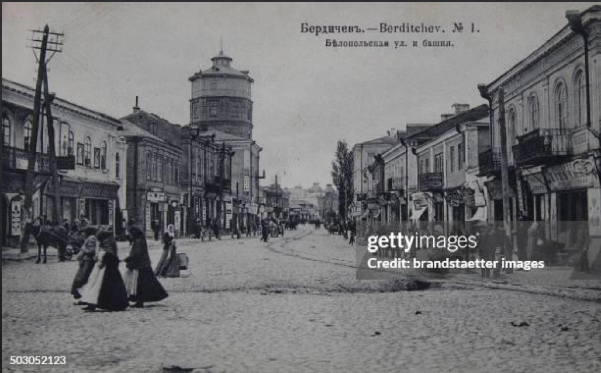
Бердичевъ.—Berdichev. № 1. Бѣлопольская ул. и башня.