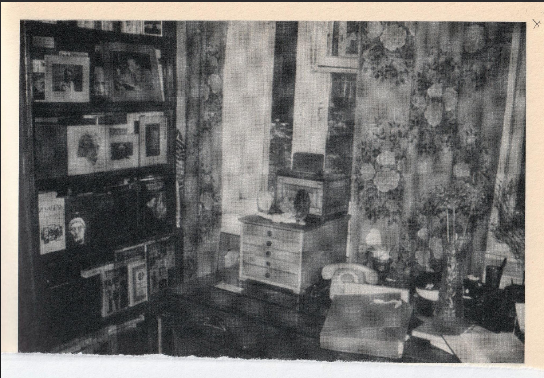
Il suo studio a Mosca