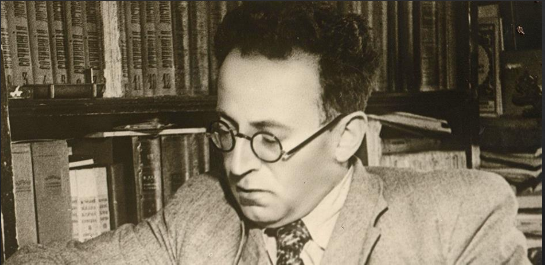
Vasilij Grossman. Immerso nei pensieri e nella scrittura