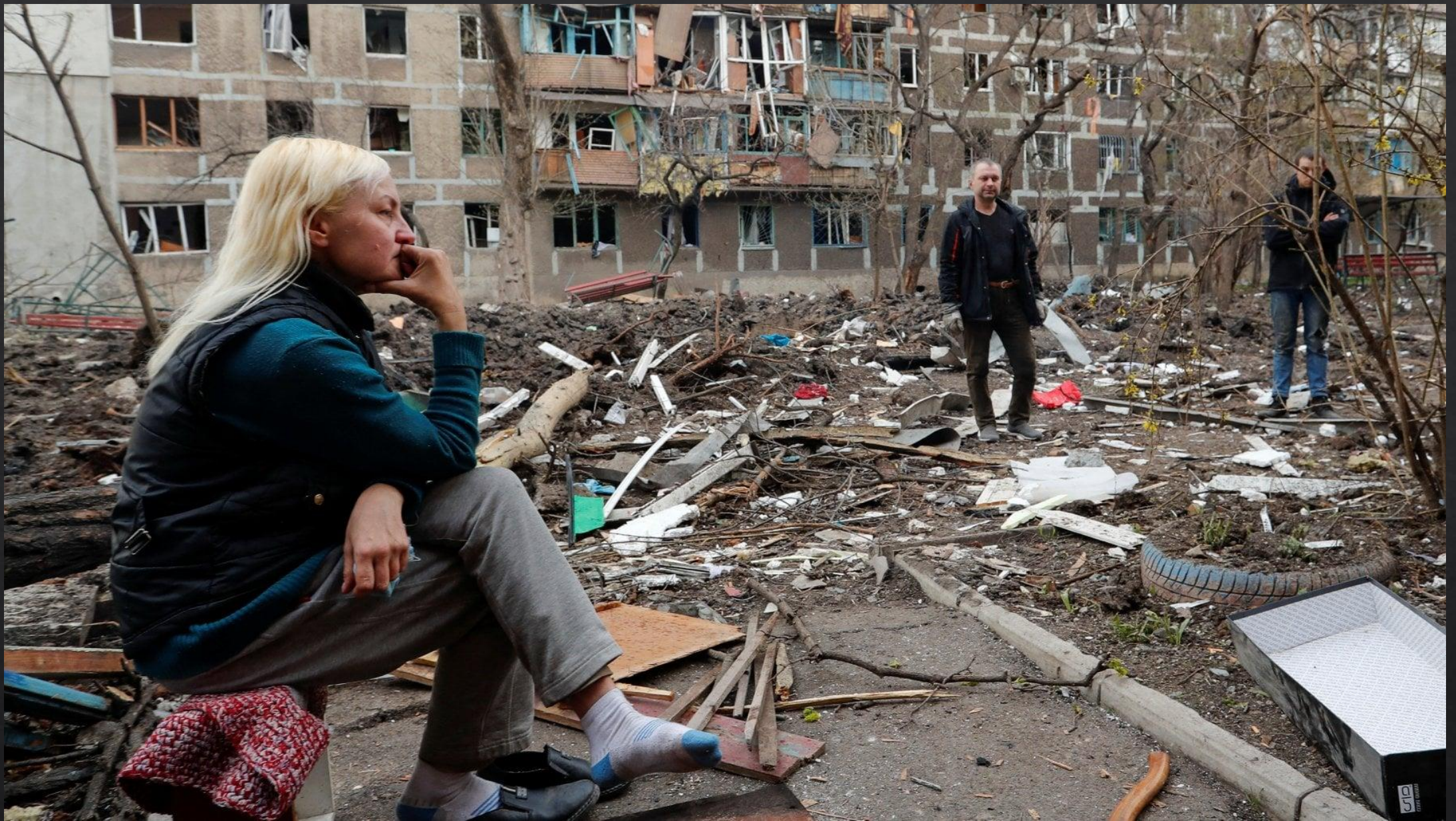
Ucraina. Distruzione e pianto dopo il 24 febbraio 2022